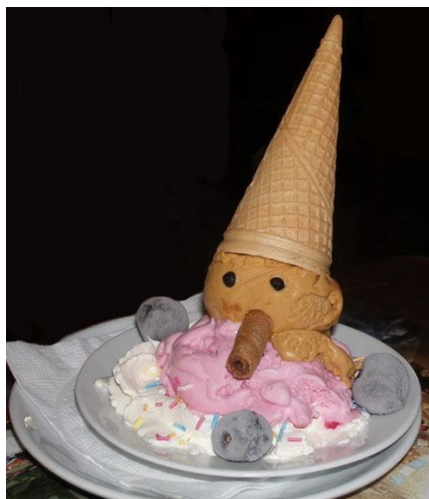
21. Мороженое с вафлями

20. Маленькие батончики из дрожжевого теста для крыши следует выпекать и устанавливать незадолго до подачи на стол (чтобы не зачерствели). Крем тоже следует готовить и отсаживать перед подачей. Детали из марципана готовятся заранее - марципан прекрасно сохраняется несколько месяцев.