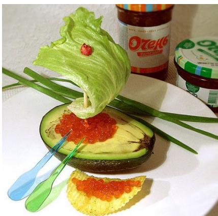
27. Лодочка, мачта - зубочистка (не следует применять шпажки и зубочистки в блюдах для совсем маленьких детей)