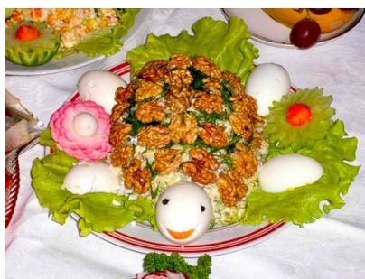
54. Украшение салата или паштета.