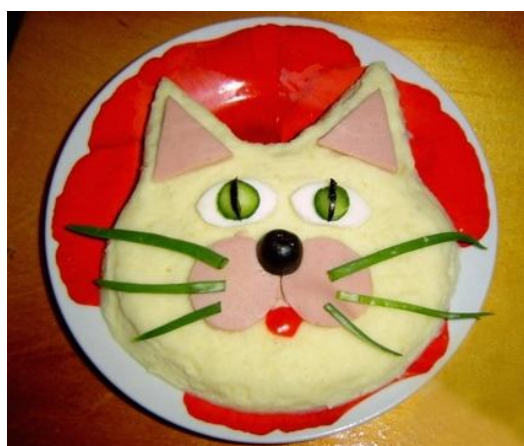
Картофельное пюре "Кот"

(из-за высокого содержания глютена детям до 3-х лет не рекомендуется)