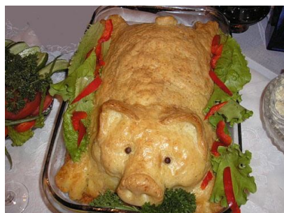
25. Пирог -поросенок.