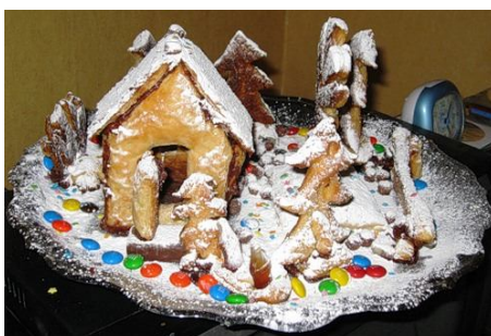
16. Пряничный домик с посыпкой сахарной пудры