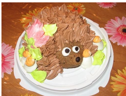
28. Пирожное " Картошка " в форме ежика.