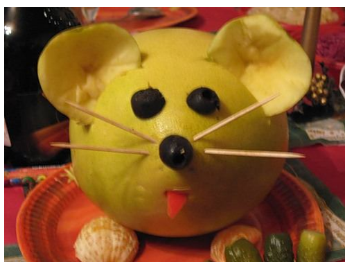
22. Мышка из лимона