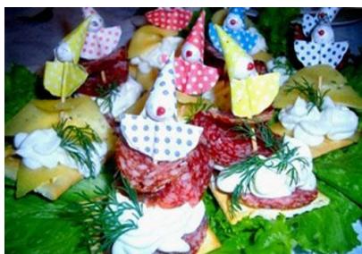
46. Бутерброды-лодочки с парусами и бумажными украшениями. Украшения изготовьте и склейте вместе с ребенком.