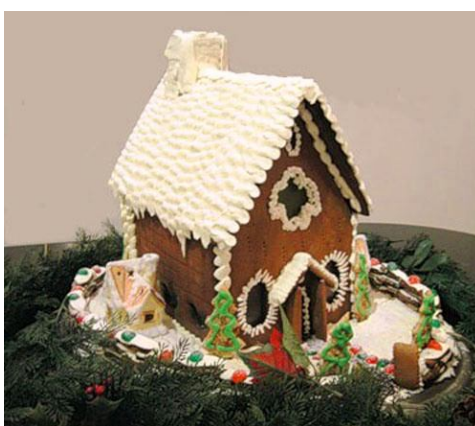
14. Пряничный домик с кремом .

Детали склеивают очень густым сахарным сиропом . Еще лучше - использовать сироп из фруктозы.