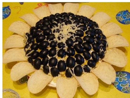
73. Здесь использованы чипсы.