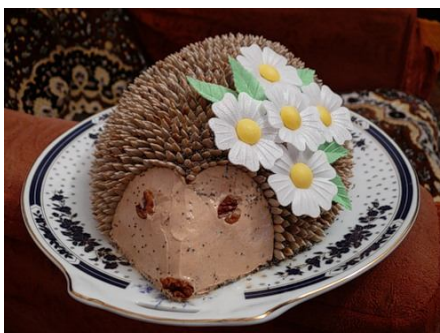
29. Укрепленные на ежике пластмассовые цветочки после подачи на стол следует снять.