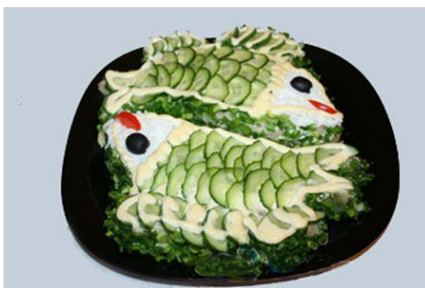
39. Овощной салат.