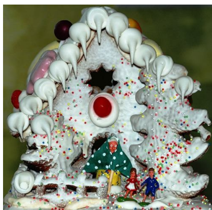
18. Пряничный домик густо покрыт белковым тестом для пирожного Меренги и подсушен в течение 25—30 мин при температуре 110—120°C.

Фигурки сделаны из марципана и установлены после выпечки.