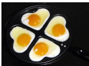
33. Если нет специальной сковородки, используйте формочки самой разнообразной формы, самостоятельно изготовленные из картона, сложенной в несколько слоев фольги, жести и т.д. Формочка изнутри смазывается маслом, ставится на сковороду и в нее вбивается яйцо.