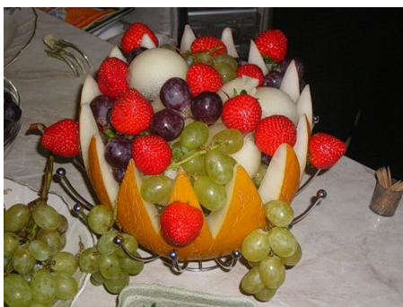
31. Ваза из дыни. См. КАРВИНГ