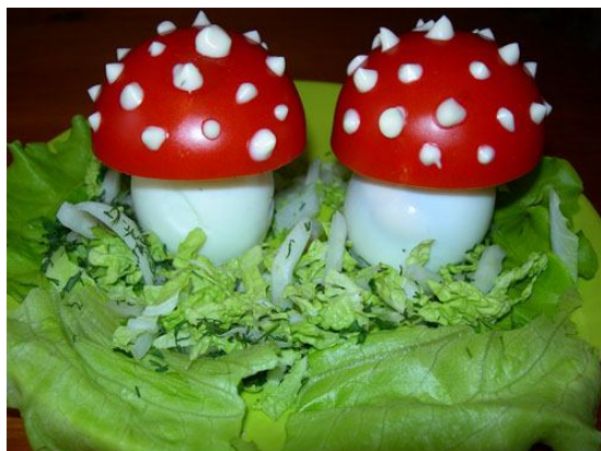
3. Салат, яйца, половинки помидоров, сметана.