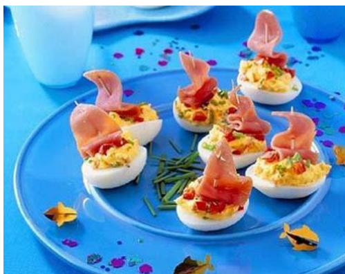
40. Фаршированные яйца-лодочки.