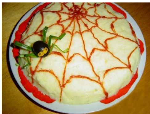
Картофельное пюре "Паутинка"