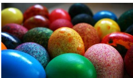
50. Детей всегда радуют крашеные яйца. Приготовьте их в качестве подарка на прощанье каждому ребенку, пришедшему в гости.