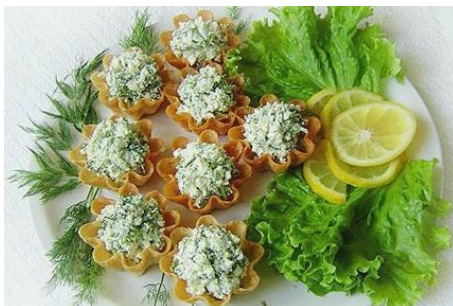
Творог в корзиночках.

Порционные блюда в корзиночках просты в приготовлении и всегда привлекательны для детей.