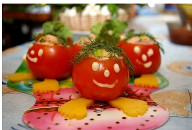
37. Фаршированные помидоры (начинка - салат, паштет и т.д.). Ножки из ломтиков сыра.