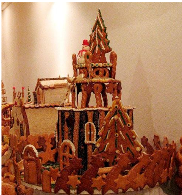
41. Городок из печенья. Постройте его вместе с ребенком, ожидая большую компанию гостей. Столь сложные сооружения не обязательно строить за один день.