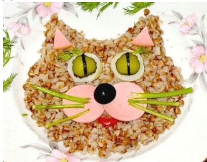
Самая полезная на свете - гречневая каша.