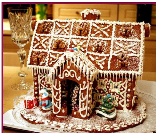
15. Пряничный домик с украшением глазурью .