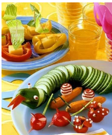
35. Змея из спиралеобразно нарезанного огурца. Или можно просто сложить из кружочков.