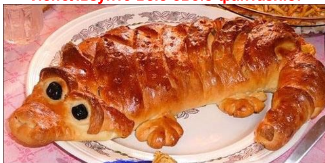
Пирог "Крокодил" - прост в приготовлении.

УКРАШЕНИЕ ДЕТСКИХ БЛЮД Используйте всю свою фантазию!