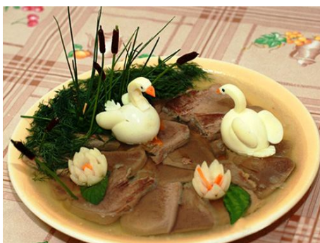
49. Лебеди и лилии из яиц.