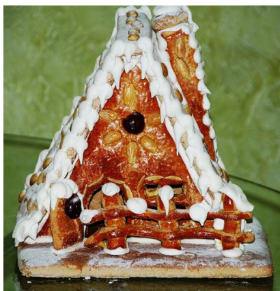
17. Для выпечки деталей пряничных домиков см. Изделия из пряничного теста .