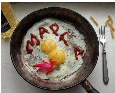
34. Детский подарок маме! Подобный подарок можно приготовить и для ребенка.