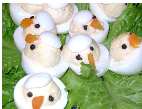
38. Фаршированные яйца