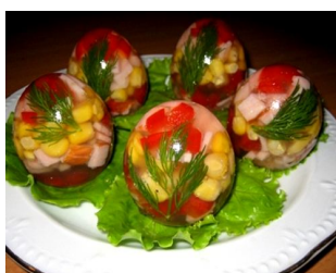
59. Желейные яйца

Сырые яйца тщательно вымыть, срезать верхушки, вылить содержимое и использовать для различных блюд. Пустую яичную скорлупу промыть, 2-3 минуты поварить в кипятке и обсушить. Затем смазать изнутри растительным маслом (лишнего масла быть не должно). Влить приготовленное остывающее желе, затем вылить и поместить на 15 минут в холодильник, чтобы слой на внутренней поверхности скорлупы застыл. Это предотвратит появление продуктов на самой поверхности. А чтобы внешний слой получился еще толще, можно повторить ополаскивание раствором желе. Затем положить в яйца различные продукты, залить желе и поставить в холодильник застывать. Когда застынет, очистить скорлупу и подать на стол. Если скорлупа прилипает к желе, перед чисткой кратко - 2-3 секунды - ополоснуть горячей водой. Примечание. Для упрощения и ускорения приготовления можно предварительно не ополаскивать скорлупу раствором желе, а сразу закладывать продукты и заливать желе.