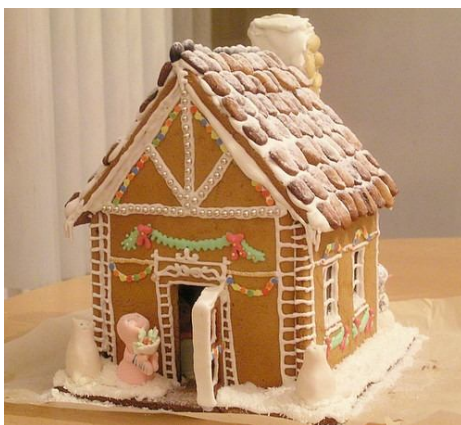
13. Пряничный домик.

Детали склеивают очень густым сахарным сиропом . Еще лучше - использовать сироп из фруктозы.