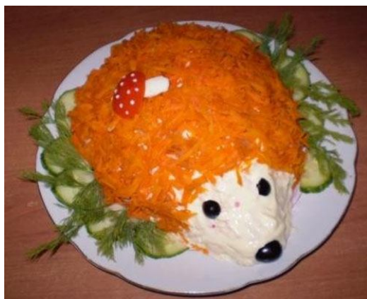
12. Оформление салата или паштета.