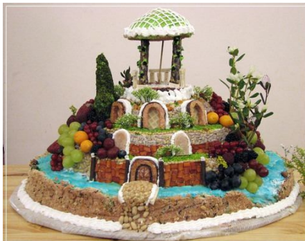
44. Внутри сооружения может сладкий торт (украшение кремом) или несладкий паштет, например, печеночный (украшается густой сметаной или майонезом).