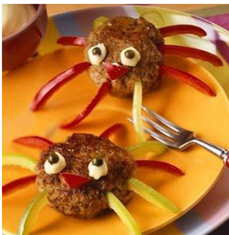
43. Страшные котлеты-пауки для бесстрашных малышей.