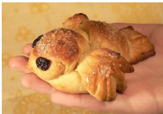
"Птичка" из дрожжевого теста