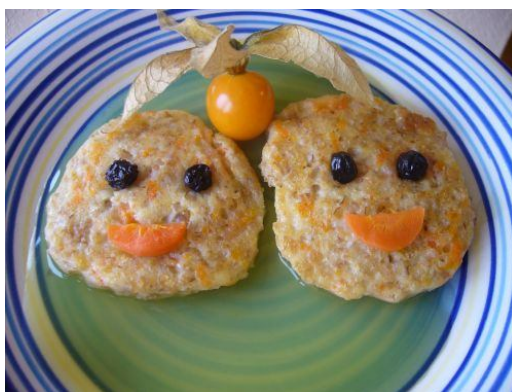
11. Украшение каши с подливкой из киселя