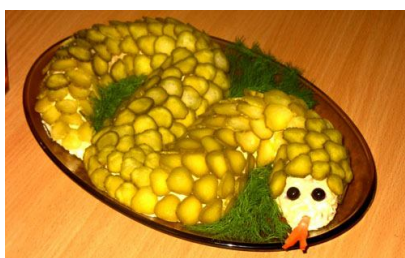
48. Несладкая творожная масса (творожный паштет) или салат Оливье, покрытый сверху ломтиками соленых или маринованных огурцов.