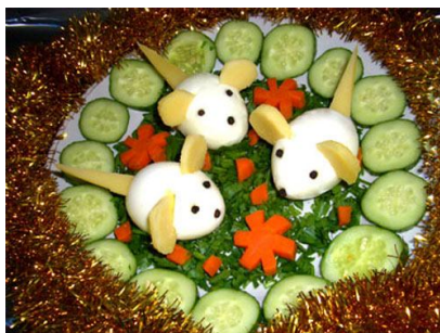
32. Используйте украшения, разложенные вокруг блюда.