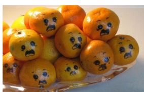
36. Нарисуйте смешные мордашки на мандаринах или апельсинах.