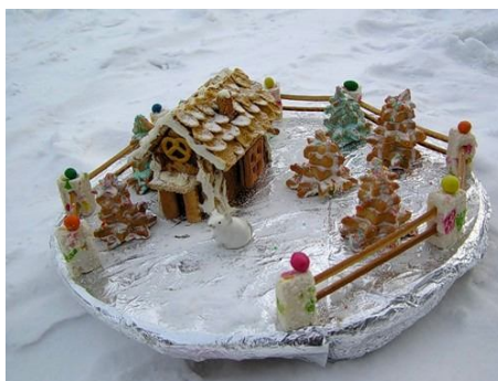
19. Обертывание блюда фольгой придает необычный вид.

Фигурки сделаны из марципана и установлены после выпечки.