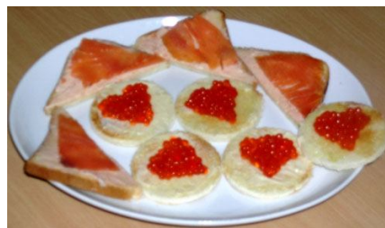
72. Нарезьте хлеб треугольничками. Продукты на хлеб или печенье выложите фигурно.