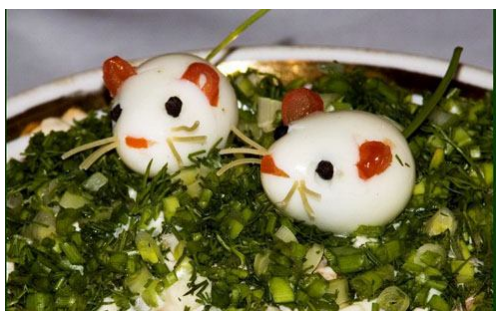
45. Украшение поверх картофельного пюре.