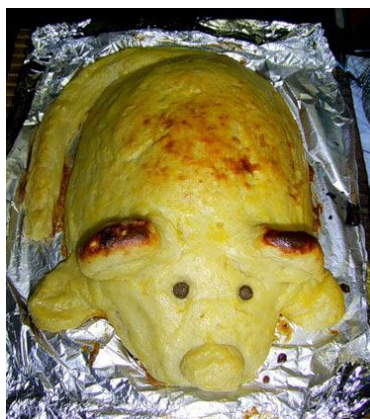
24. Поросенок- кулебяка .

ПРИМЕЧАНИЕ. Масса для пирожного " Картошка " позволяет лепить различные фигурки, делать корзиночки для наполнения ягодами, муссом, творожной массой, кремом и даже создавать целые сооружения - домики, башни, дворцы и т.п.