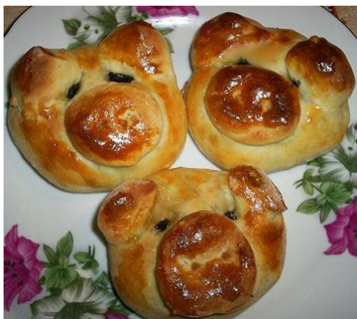
10. Хрюшки-ватрушки (внутри творожная начинка, закрытая "пяточком", глазки - изюминки)