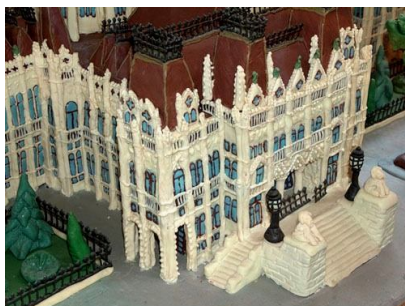
60. Пряничный дворец для большого количества гостей.

Сырые яйца тщательно вымыть, срезать верхушки, вылить содержимое и использовать для различных блюд. Пустую яичную скорлупу промыть, 2-3 минуты поварить в кипятке и обсушить. Затем смазать изнутри растительным маслом (лишнего масла быть не должно). Влить приготовленное остывающее желе, затем вылить и поместить на 15 минут в холодильник, чтобы слой на внутренней поверхности скорлупы застыл. Это предотвратит появление продуктов на самой поверхности. А чтобы внешний слой получился еще толще, можно повторить ополаскивание раствором желе. Затем положить в яйца различные продукты, залить желе и поставить в холодильник застывать. Когда застынет, очистить скорлупу и подать на стол. Если скорлупа прилипает к желе, перед чисткой кратко - 2-3 секунды - ополоснуть горячей водой. Примечание. Для упрощения и ускорения приготовления можно предварительно не ополаскивать скорлупу раствором желе, а сразу закладывать продукты и заливать желе.