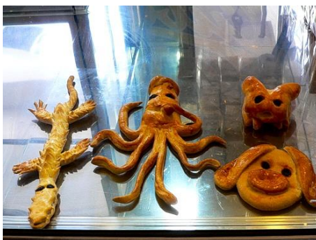
42. Выпечка из сдобного дрожжевого теста.