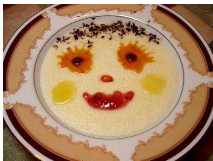
Манная каша .

(из-за высокого содержания глютена детям до 3-х лет не рекомендуется)