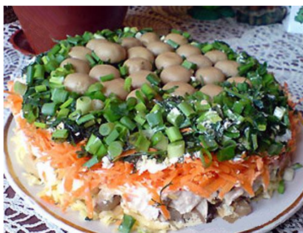
55. "Торт" из салата Оливье или горячего картофельного пюре, украшенный зеленью и маленькими шляпками грибов.