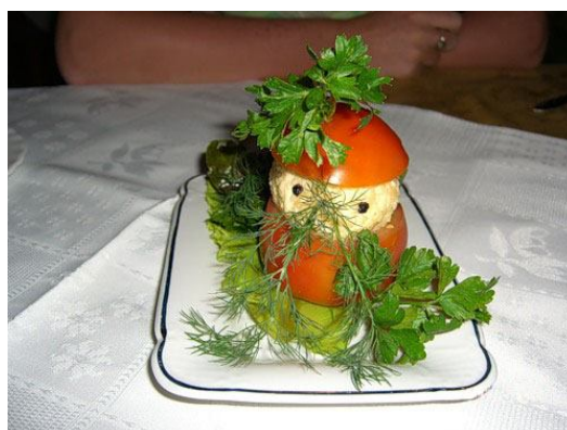
4. Фаршированный помидор.