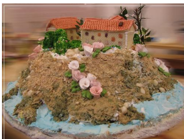
61. Так можно сервировать сладкую творожную массу. Для окрашивания в коричневый цвет добавить какао.